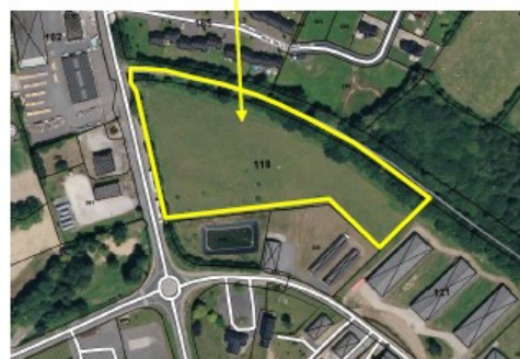
Localisation EBC, parcelle AK 118 – commune de Domfront